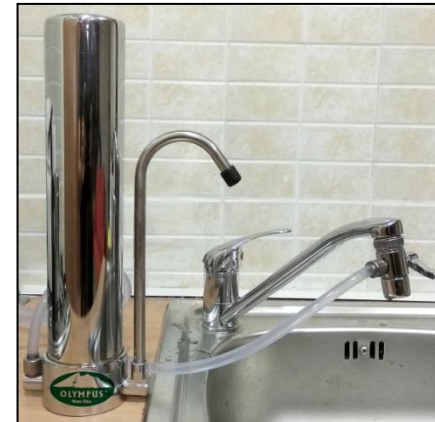
Συσκευή συνδεδεμένη σε βρύση κουζίνας