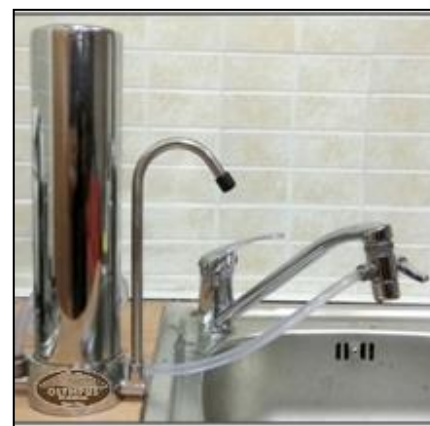
Συσκευή συνδεδεμένη σε βρύση κουζίνας